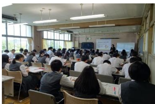
2019. 7 田方農業高等学校