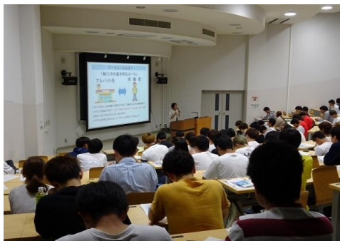
2019. 6 静岡産業大学

自己アピール 社会に出てからの厳しい現実をたくさん経験してきました。また、子育てをしながら働く女性の大変さも身をもって実感しています。わかりやすい、伝わりやすい言葉でお話できると思います。